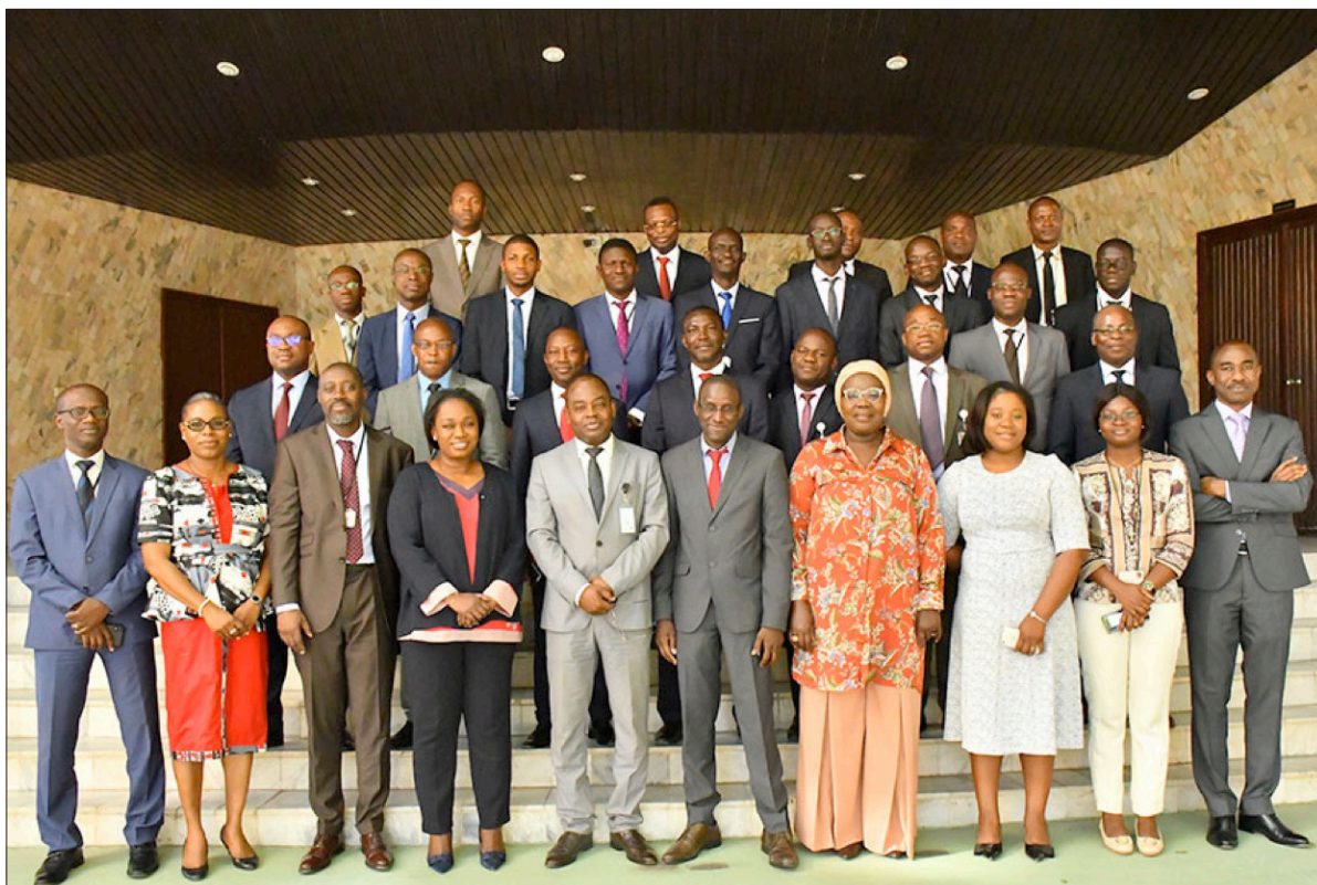
Photo de famille à l'ouverture du séminaire animé par le Professeur SOUMARE de l'Université Laval (Canada)