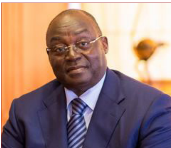
Tiémoko Meyliet KONE

D epuis le 1 er octobre 2019, j'ai procédé à une réorganisation des Services Centraux de la Banque Centrale qui a consacré la transformation de la Direction du Centre Ouest Africain de Formation et d'Etudes Bancaires (COFEB) en une Direction Générale. En opérant cette réforme, j'ai voulu impulser une nouvelle dynamique dans les domaines de la formation et de la recherche au sein de l'Institut d'émission.