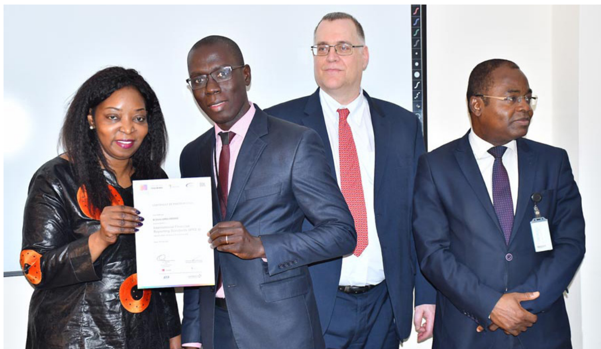
Remise de diplôme à l'issue de la formation sur le thème « Normes IFRS », le 24 février 2020 au COFEB

Les formations de courte durée (séminaires) sont destinées au renforcement des compétences techniques et professionnelles des acteurs du secteur bancaire et financier. L'enjeu est de fournir une offre non couverte au niveau local à travers des produits de formation de haut niveau, en partenariat avec des institutions de renom.